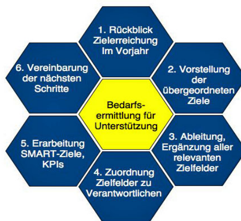
Abb. 1 Die sechs Schritte einer Zielklausur

Zielklausuren haben sich als die einzige geeignete Maßnahme erwiesen, um wichtige Unternehmensziele sinnvoll mit Zielen für Abteilungen und Mitarbeiter zu verknüpfen. (Auch Mitarbeiter ist hier eine Funktionsbezeichnung und schließt Personen jeden Geschlechts ein). Gerade in mittelständischen Unternehmen oder Unternehmensbereichen reicht oft eine Klausur von Leitung und Führungskräften aus. Im Anschluss sollten Führungskräfte dann mit ihren Mitarbeitern eine Klausur in ähnlicher Form durchführen. Die dafür notwendige Zeit lohnt sich. Hier wird eine Zielklausur für Leitung und Führungskräfte beschrieben. Eine Zielklausur läuft in 6 Schritten ab (Abbildung 1)